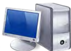
自社のみ操作可能